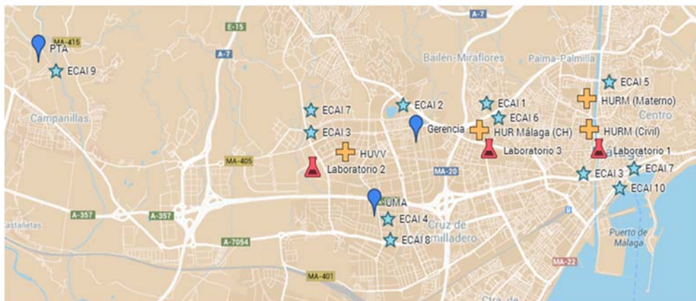
Distribución de las ECAI y laboratorios en el área metropolitana de la ciudad de Málaga.

La localización geográfica de las ECAIS de IBIMA se muestra en la figura adjunta: